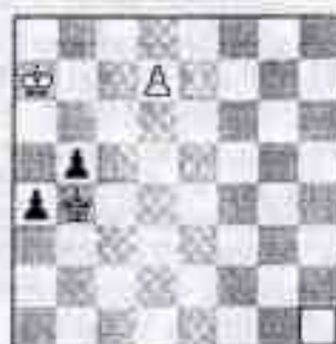
Problema n.26 T. R. DAWSON (Inghilterra) 'Wiener Schachzeitung' 1924

Iniziamo con un automatto del grande compositore inglese Dawson, pioniere di analisi retrograda e fantasie. Compose 5320 bizzarrie, 885 diretti, 97 automatati e 138 studi ottenendo circa 350 riconoscimenti tra premi, menzioni e lodi.