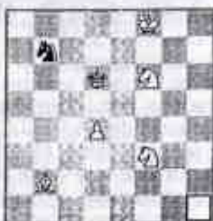
Problema n.27 STEFAN EBERLE (Austria) 1° Premio 'Byuletin' 1958

Di seguito un automatto di S. Eberle (1893-1965) che iniziò a comporre, particolarmente i diretti con più mosse, dopo i 60 anni.